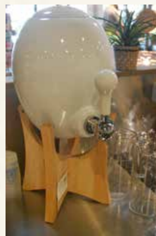
Fontaine Mélusine du Caba Croq'

A bientôt lors de nos animations magasins pour analyser votre eau, répondre à toutes vos questions et vous proposer un diagnostic gratuit et personnalisé.